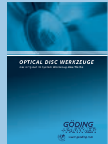
Optical Disc Werkzeuge

Das Original im System Werkzeug-Oberfläche